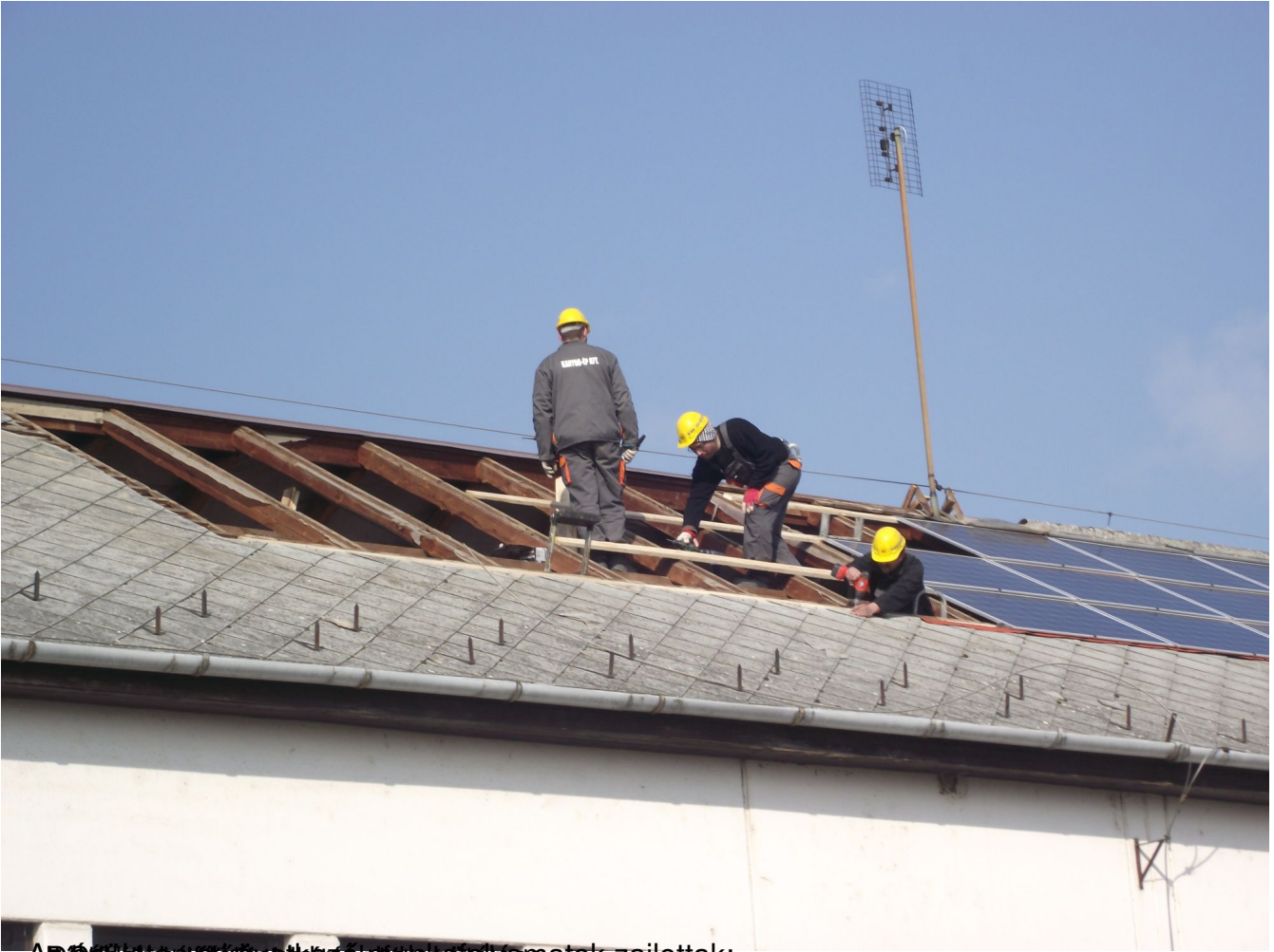
Arbiteri munka során a munkások a munkát zajlottak: