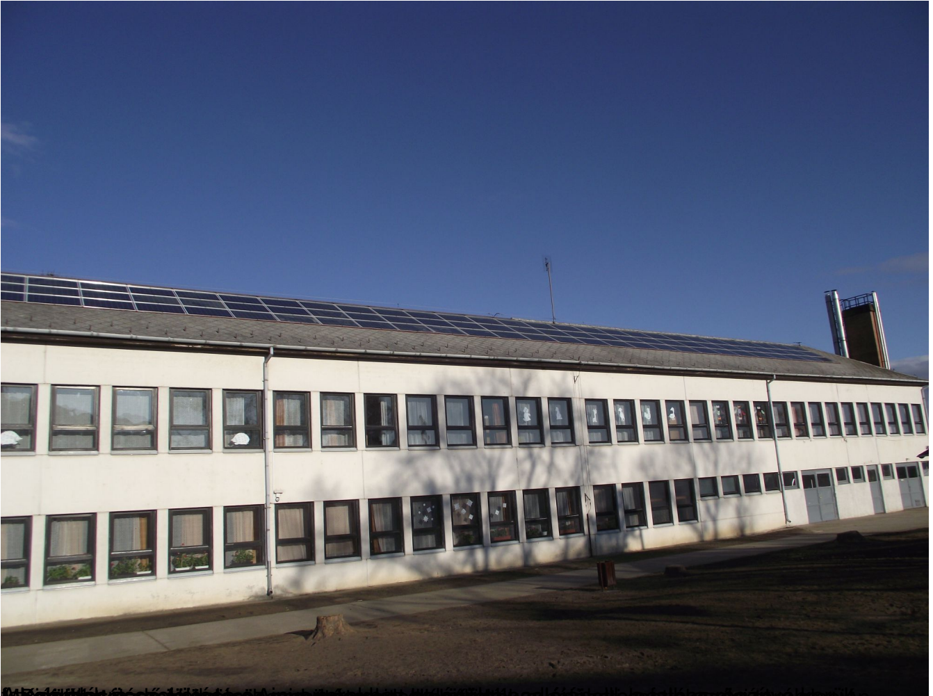
Működésének első évében a létesítményben a megújuló energiák használatát a szolár energiára alapozták.